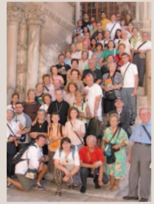
PELLEGRINI Al Santo Sepolcro